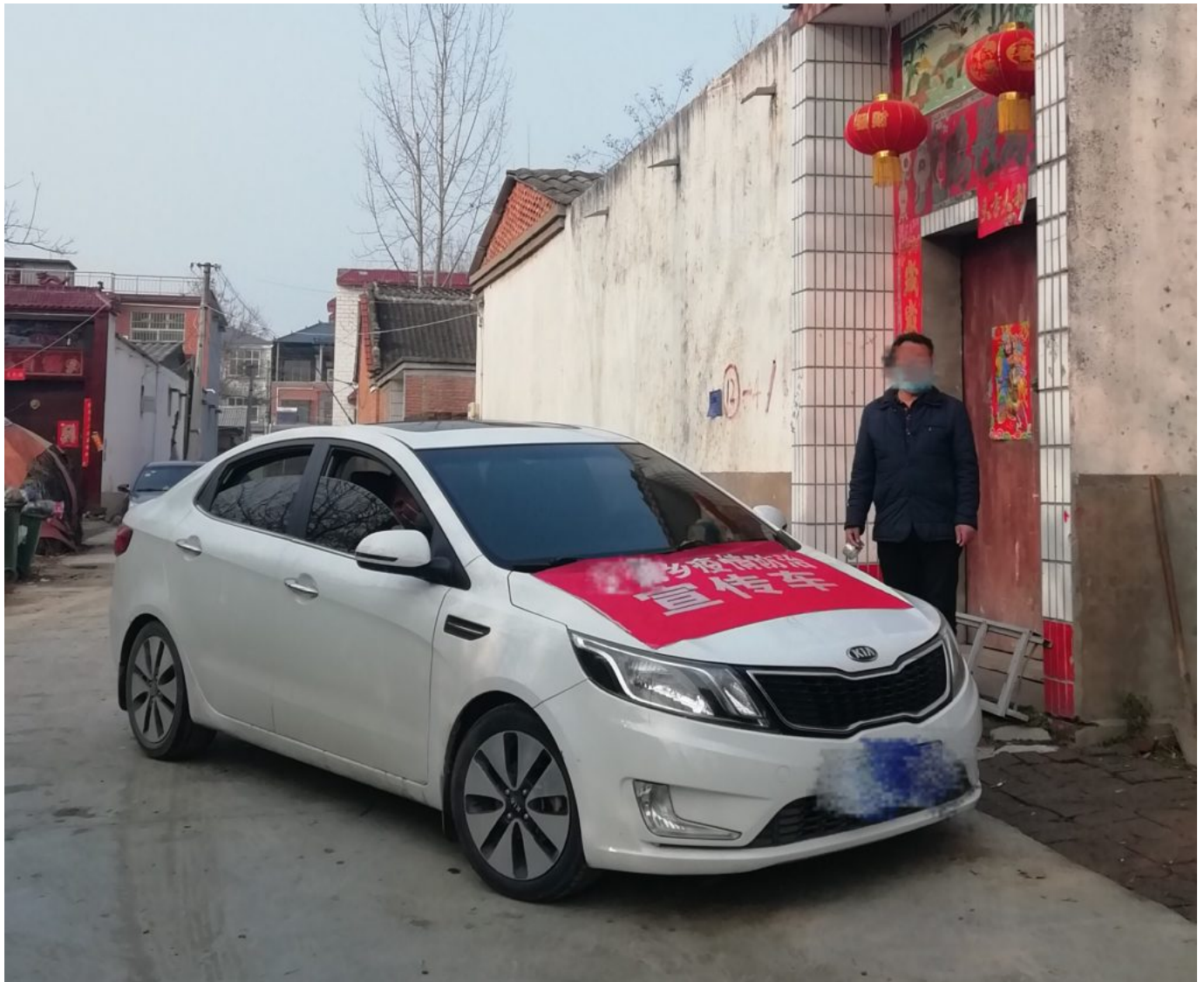
图2：中国村庄内的巡逻车（图片非本研究点所摄）。

另外，志愿者和干部们会定期巡查街道，有时还会在疫情防治巡逻车中通过喇叭喊话，提示人们待在家中（见图2）。另一个位于河南城郊的村庄实现了视频监控设备的全覆盖。在封锁期间，一旦有人离家外出，村里会通过有线广播喊话，令其立刻回家，并在村里的微信群中对其进行通报批评。